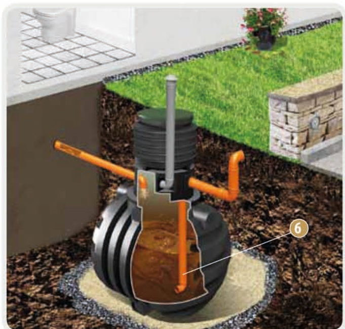
Zainstalowana rura poboru - opcja